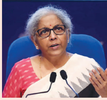
और लाभ की सीमा का विस्तार किया गया था। साथ ही, पात्र उधारकर्ताओं

आग्रह किया जाएगा। सूत्रों के मुताबिक, इमरजेंसी क्रेडिट लाइन गारंटी स्कीम समेत सरकारी योजनाओं के विभिन्न खंडों और प्रगति की व्यापक समीक्षा की जाएगी। बता दें कि बजट में ECLGS को मार्च 2023 तक एक साल के लिए बढ़ा दिया गया था। इसके अलावा, योजना के लिए गारंटी कवर को 50,000 करोड़ रुपये से बढ़ाकर 5 लाख करोड़ रुपये कर दिया गया था। ईसीएलजीएस 3.0 के तहत आतिथ्य, यात्रा, पर्यटन और नागरिक उड्डयन क्षेत्रों के लिए कवरेज, दायरा