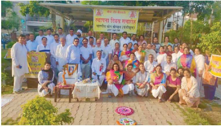
भारतीय योग संस्थान 10 अप्रैल 1967 को एक छोटे से पौधे के रूप में उजागर